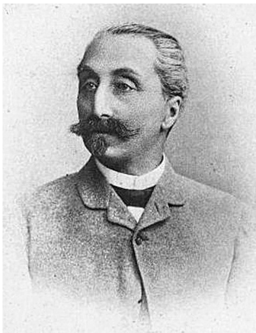
Dimitrie Ghica-Comănești , jurist, doctor în drept, explorator român, politician, aventurier, unul dintre cei mai faimoși exploratori români.